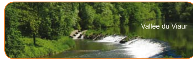
Vallée du Viaur

Trésor du Viaur : Elevage de canards et veau d'Aveyron à Bibal (La Salvetat Peyralès). Gratuit, sur rendez-vous. Ferme de la vallée du Jaoul : Elevage de canards et oies, conserves fines à Murat (La Salvetat Peyralès). Gratuit, sur rendez-vous. Ferme de la Gardelle : Elevage de canards fermiers du Ségala (La Salvetat Peyralès). Gratuit, dégustation sur rendez-vous. Ferme Félix Gourmand : Elevage de canards gras, à Félix (Prévinquières). Gratuit, sur rendez-vous. Ferme patrimoine de la Borie Basse (Cabanès) : Ferme patrimoine des 17 et 18ème siècles. Maison témoin, four, porche, sécadou... Gratuit, sur RDV. Musée de la forge et de l'ancienne vie rurale (Lescure Jaoul) Reconstitution d'un atelier de forgeron, outillage et exposition de photos sur les traditions agricoles du Pays. Tarif : 1,5€, sur rendez-vous. Musée de la Résistance de Villelongue (Cabanès) : Ce petit musée est aménagé dans la chapelle du même nom. Photos de maquis et photos des sabotages qui ont eu lieu en Aveyron témoignent de l'activité de la Résistance dans le Département. Ouvert sur rendez-vous du 1/05 au 31/12, gratuit.